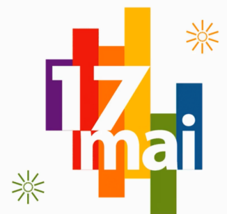
Journée internationale contre l'homophobie et la transphobie

Le conseil de la Municipalité d'Inverness proclame le 17 mai 2024 Journée internationale contre l'homophobie et la transphobie.