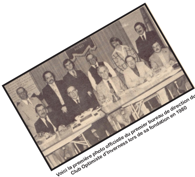
Voici la première photo officielle du premier bureau de direction du Club Optimiste d'Inverness lors de sa fondation en 1980