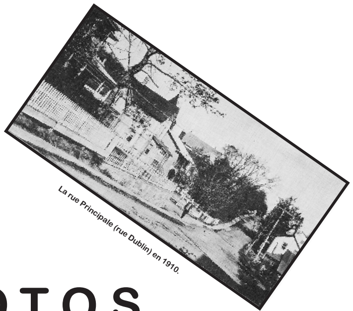
La rue Principale (rue Dublin) en 1910.