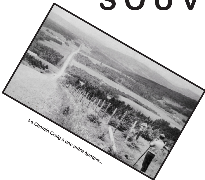
Le Chemin Craig à une autre époque...