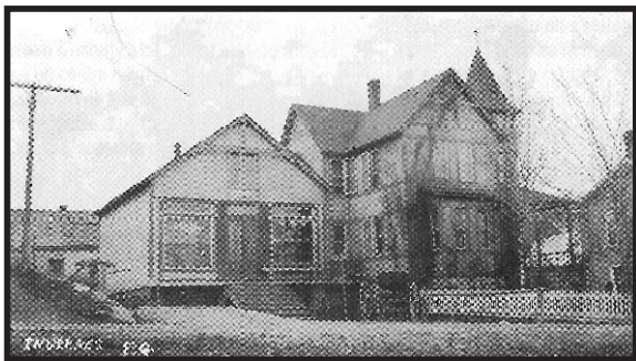
Le magasin général qui faisait office, également, de bureau de poste vers 1900. Ce site est maintenant occupé par le stationnement de l'ancienne auberge d'Inverness.